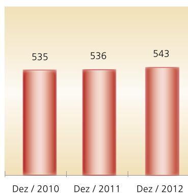
Patrimônio Líquido R$ Milhões