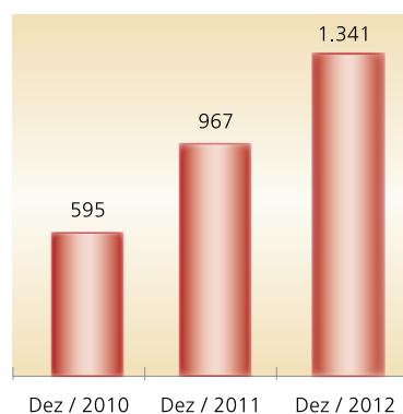
Carteira de Crédito R$ Milhões